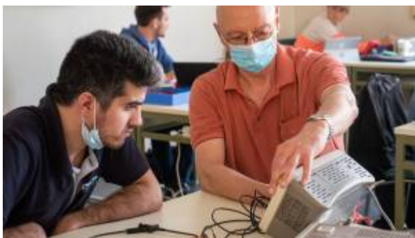
Fig. 1: ET1 Labor im SS2020