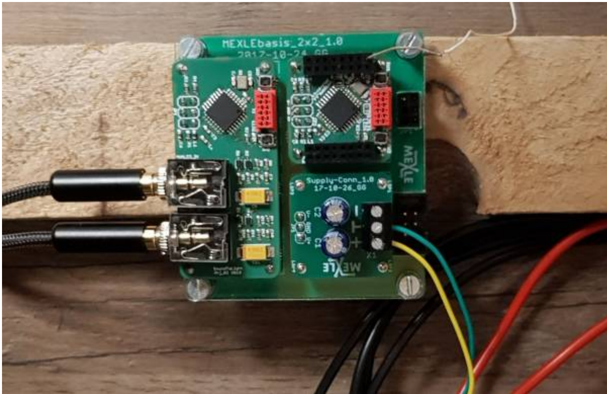
Elektronik des LED cube auf MEXLE2020 Basis (zwei ATmega328 zur Auswertung von Musiksignalen mit Eingangsfilter und FFT, sowie zur Ansteuerung des Würfels)