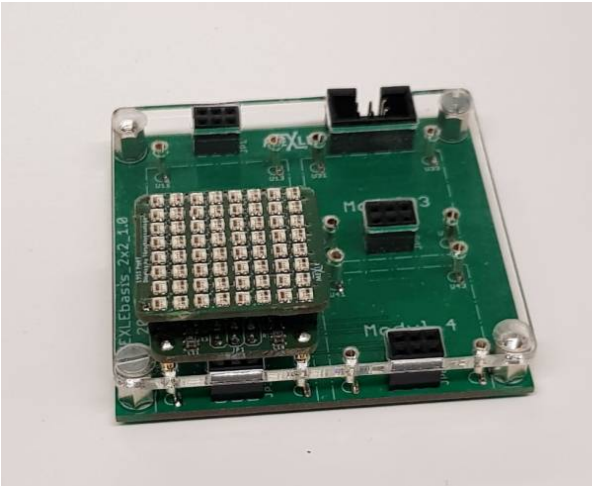
MEXLE Microcontroller Board mit selbst entwickeltem 8x8 Farb-LED Matrix (WS2812) auf 25x25mm 2