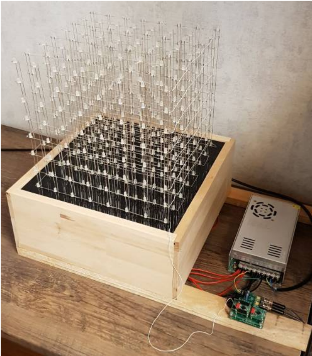
LED cube entwickelt im 3. Semester Mechatronik und Robotik