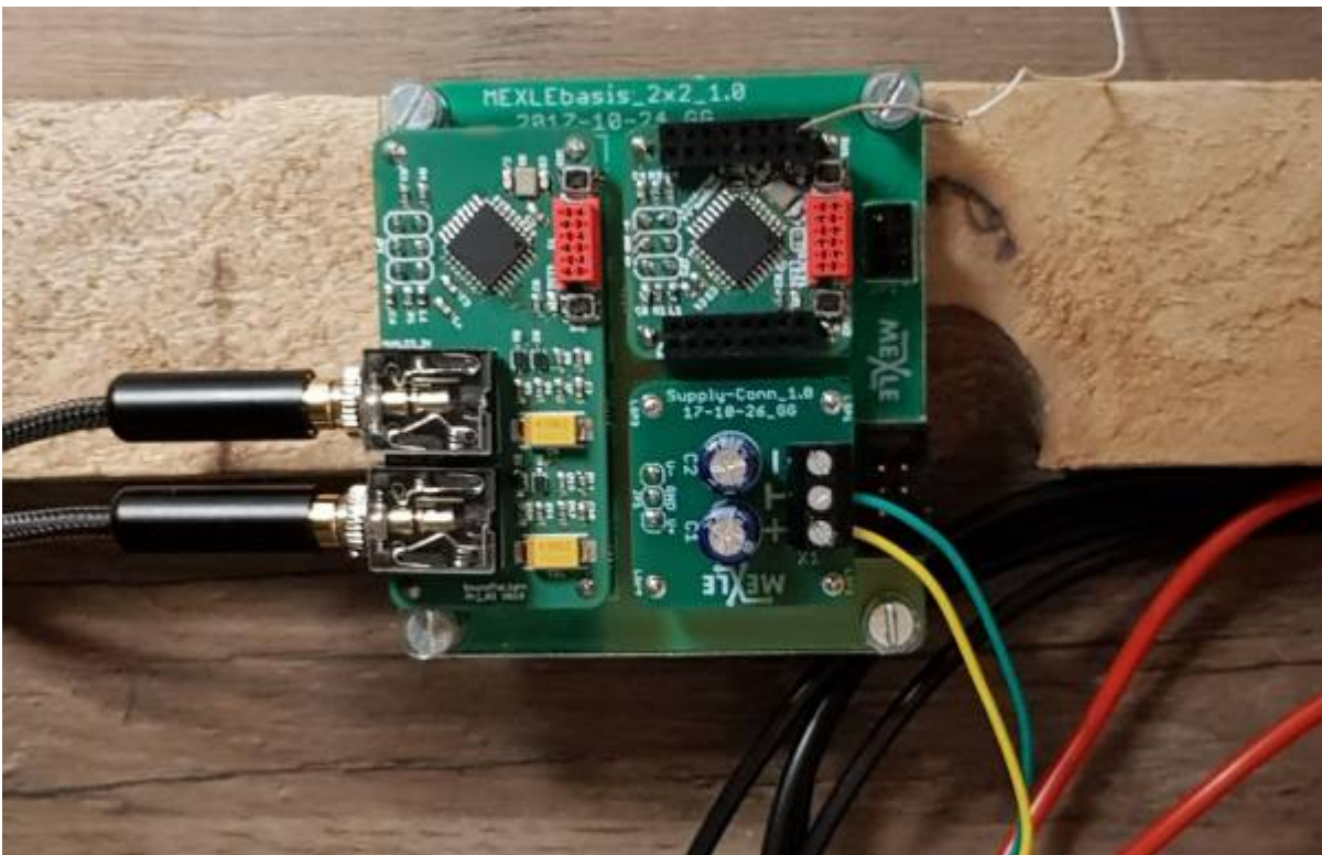
Elektronik des LED cube auf MEXLE2020 Basis (zwei ATmega328 zur Auswertung von