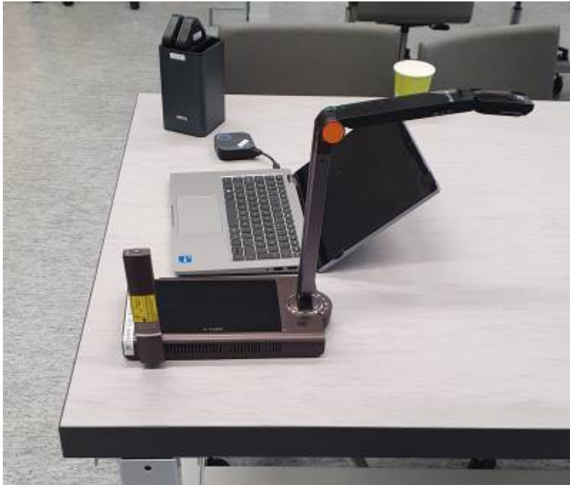
Physiklabor Bild 3